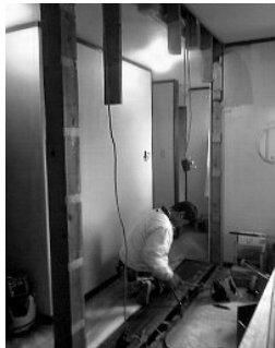
間仕切壁撤去後の様子

元々お部屋を仕切って二階のお部屋を仕切っている間仕切壁。それを撤去して廊下を部屋の中へ取り込む。廊下のスペース(約2.5帖分)とクローゼット(1帖分)をお部屋として利用する工事。